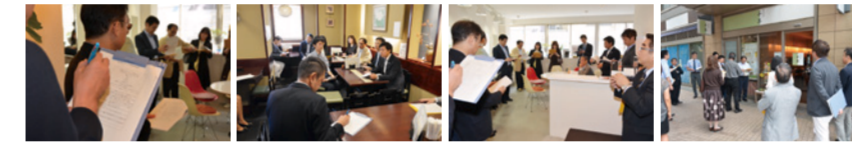
▲昨年の実地巡回審査の様子