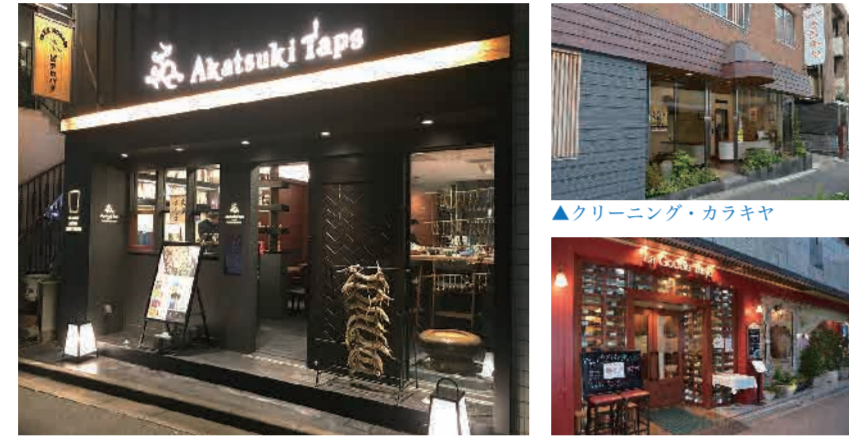
▲暁タップス芝大門《ピアロバタ》

港区商店グランプリの受賞店舗が決定 港区長賞は「暁タップス芝大門《ピアロバタ》」